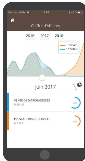
Aperçu en version mobile